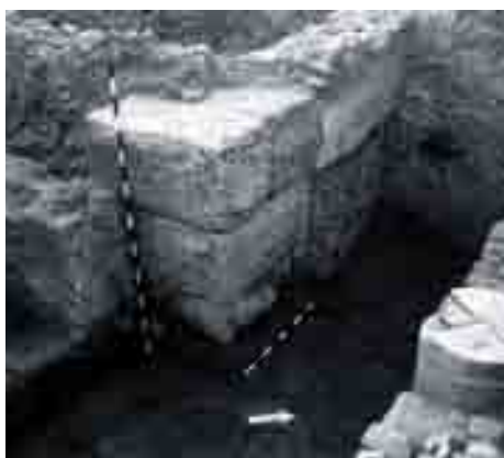
Detalle del cierre de las piletas. Excavación en calle Cerrojo 24–26. Director: Gonzalo Pineda, 1999.

Ese borde meridional se mantuvo construido y fue amortizado en idéntica fechas en el área frontera, al otro lado del río. Dejamos el Barrio de la Trinidad abandonado en época fenicia, debiendo señalar la ocupación constatada en época altoimperial desde el siglo I. Conocemos sus dedicación a la producción anfórica por la aparición de varios hornos alfareros 35 en torno a la calle Cerrojo, que se abre, como una vía meridional de acceso y salida por el oeste y que, prolongándose por el Paseo de los Tilos y Camino de Churriana, marcará el límite de ocupación de suelo.