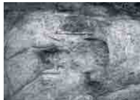
Tumba de incineración de inicios del siglo VI a.n.e. Excavación en calle Tiro 3-9, Málaga, 2005. Director: Francisco Melero García.

Se complementa, en parte, la explicación de ese proceso con datos aparecidos bajo el antiguo edificio de Correos, 8 documentando niveles constructivos fenicios. Nos interesa destacar que “El depósito de material asociado, muy