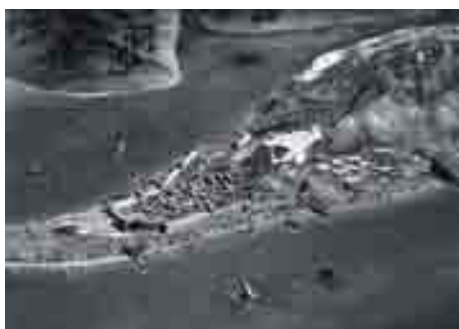
La ciudad fenicia y púnica. El proceso de asentamiento. Infografía: Arketipo, S.C.A. Publicada en "Málaga y su provincia. Ayer y hoy". Guía Fácil. Ediciones Ilustres S.L.

tectos, promotores y administraciones) facilitando la información disponible. En primer lugar valorando lo que existe, indicando dónde y cómo se encuentra, para establecer que puede aportar el estudio de la evolución de esta ciudad al conocimiento histórico, cómo alcanzarlo y en qué medida debe contribuir ese Patrimonio a hacer Ciudad mediante su puesta en valor.