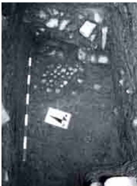
Pavimento de conchas en solar de calle San Agustín 6. Director 1ª fase: A. Cumpian Rodríguez, 2001.

¿Cómo se caracteriza el espacio intramuros? La disposición de la cerca urbana modifica la orientaciones de las plantas a partir del siglo VI, y a ella deberán acomodarse tanto los edificios como los viarios. Aunque no podamos avanzar aún la conformación del parcelario interno y su red de tránsito, si nos orientamos con las técnicas constructivas: Paramentos con zócalos de mampostería careada y calzos de ripio, trabados con barro, que elevarían su alzado con fábricas de tierra (tapiales) y profusión de adobes en los pavimentos, que prestan el hermoso colorido de las arcillas a las construcciones (verdes, amarillo, anaranjados...) si bien condicionan una enorme vulnerabilidad en la conservación y exposición exenta de los restos.