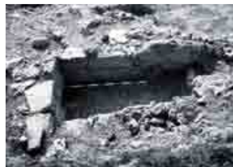
Estructura funeraria 6, Excavación calle Campos Eliseos, Necrópolis de Gibralfaro, Málaga, 1998. Directores: J.A. Martín Ruiz y A. Pérez-Malumbres Landa.

Hipótesis sobre los trazados de la muralla de Malaka (s. VI a.n.e.) y Malaka (s. III d.n.e.) basada en el registro arqueológico.