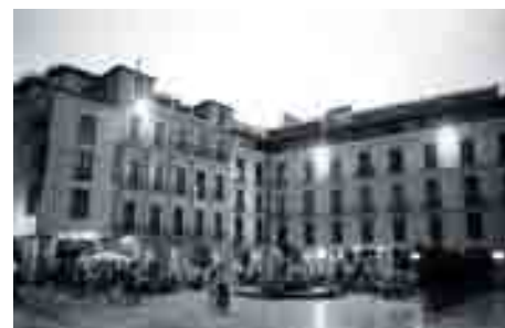
Plaza del Obispo en 1995 y en 1997, una de las primeras actuaciones integrales.