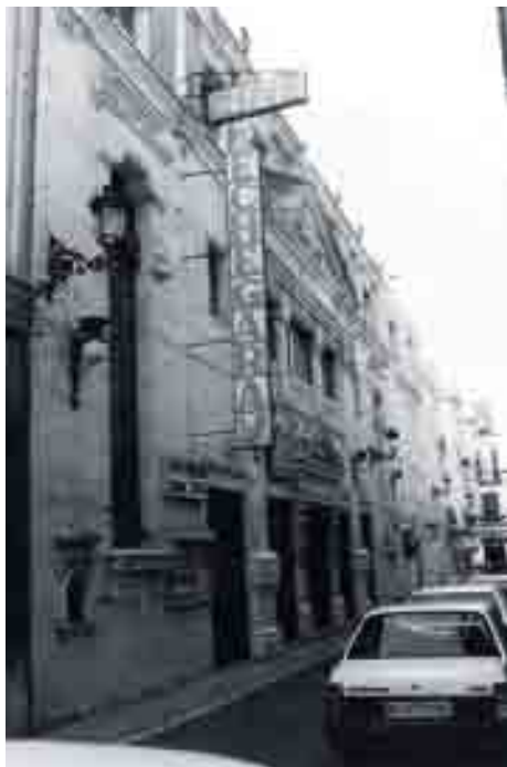
El Teatro Echegaray en 1995 y en 2010, después de su rehabilitación.