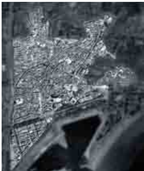
Ámbito del PEPRÍ 1990.

el territorio urbano, ralentización severa del sector inmobiliario, y sobre la incipiente transformación de los centros históricos, que difícilmente estaban soportando la combinación de transformación terciaria y degradación física y social.