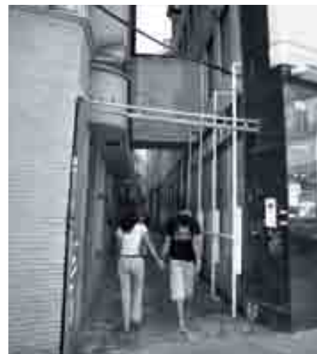
La remodelación del pasaje Heredia, una de las propuestas iniciales de Urban todavía no iniciada.

Esta situación puede conducir a descartar ciertos tipos de proyectos, cualesquiera que sean sus beneficios actuales. En ese sentido la planificación turística de la ciudad antigua debe estar “limitada por la oferta” y no dirigida por la demanda. Economía turística, ocio y patrimonio cultural deben formar parte del proceso de ordenación del territorio del Centro Histórico.