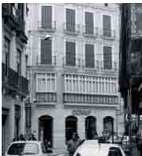
Buen ejemplo de remodelación de huecos en calle Granada, 1999.

hectáreas, y de los que se realizó una exhaustiva ficha sobre sus características de edificación, aunque el énfasis del estudio radicaba en los revestimientos y el color de la Málaga histórica.